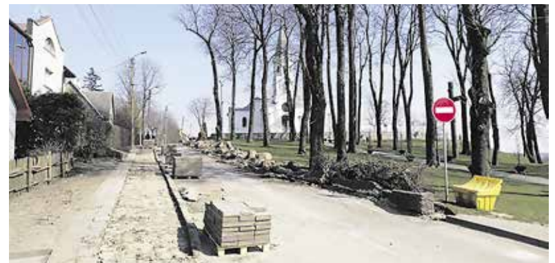
Savivaldybė, atsižvelgdama į gyventojų prašymus ir prastą Telšių miesto Šviesos gatvės būklę, pradeda šios gatvės rekonstrukciją.